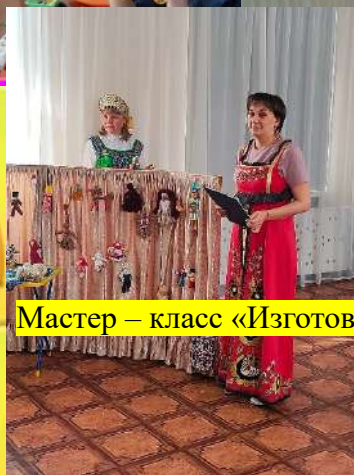
Мастер – класс «Изготовление тряпичной куклы»