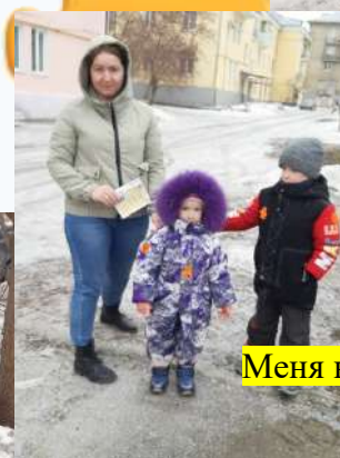
Меня на дороге видно