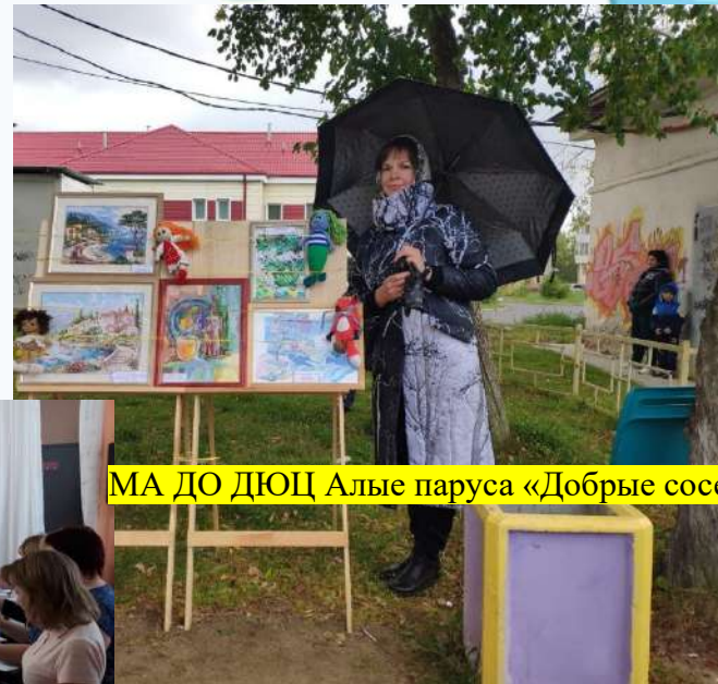
МА ДО ДЮЦ Алые паруса «Добрые соседи»