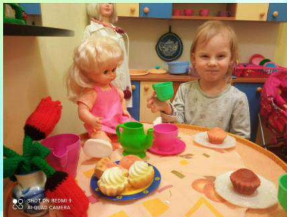
«В гости кукла к нам пришла»