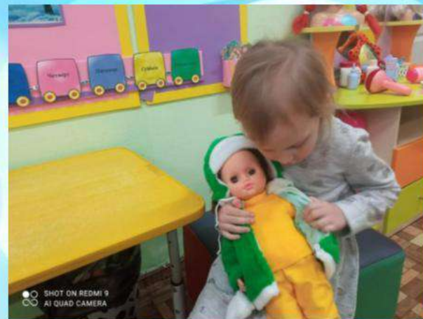
«Кукла идет на прогулку»