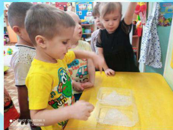
«Опыты со снегом» (качество талой воды).