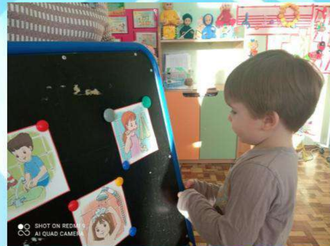
«Разложи картинки по порядку»