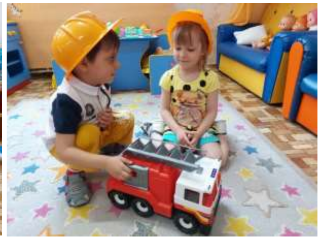
Обогащение уголка безопасности в группе.