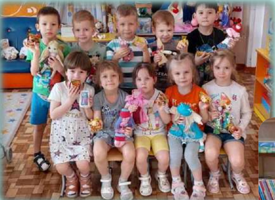
Музей «Тряпичная кукла»