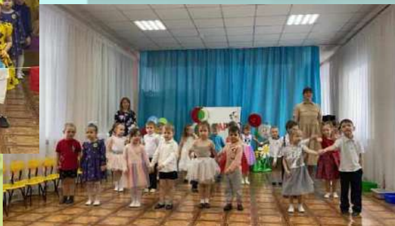
«Прощание с елочкой»