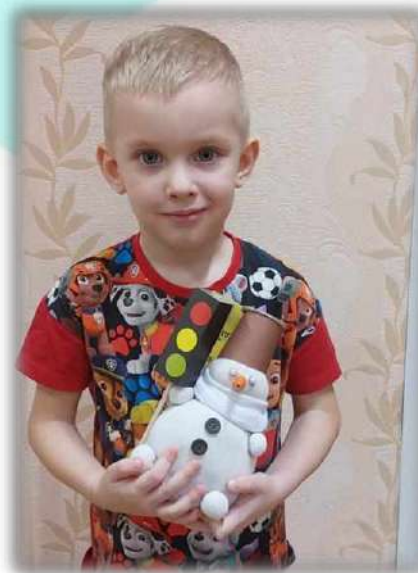
Городской конкурс ГИБДД «Игрушка на елочку» 1 место