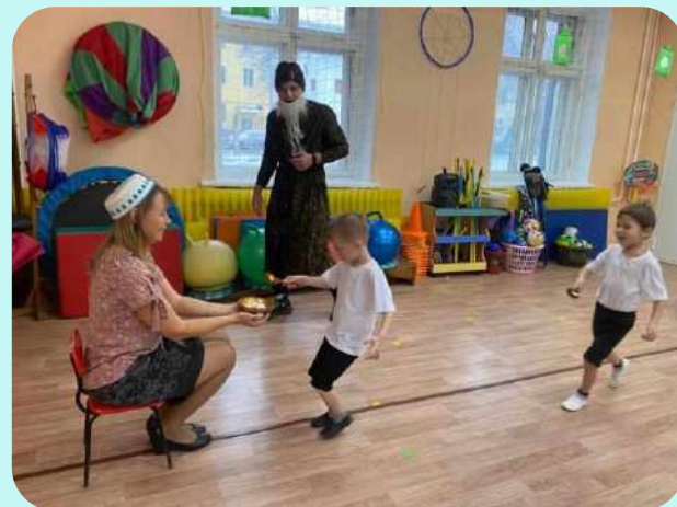
«Будь всегда здоров»