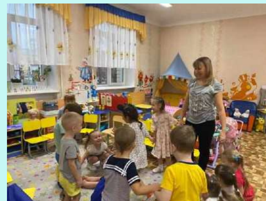
«Вместе весело играть»