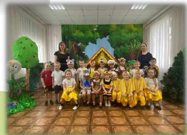
Неделя театра Сказка «Кто сказал МЯУ?»