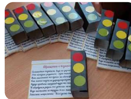
Акция ПДД «Письмо водителю»