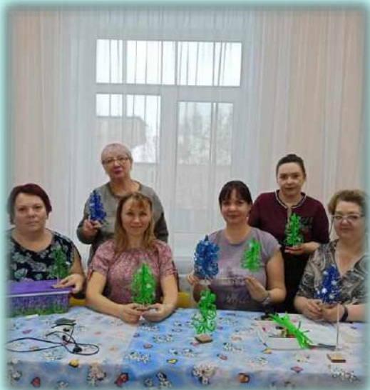
«Мастер-класс из синельной проволоки»