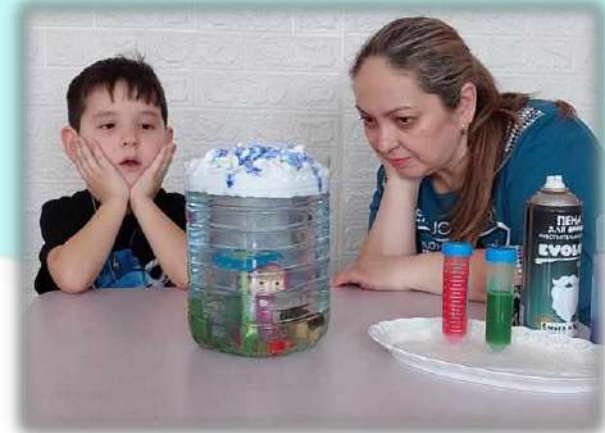
Городской конкурс «Домашняя лаборатория» 3 место