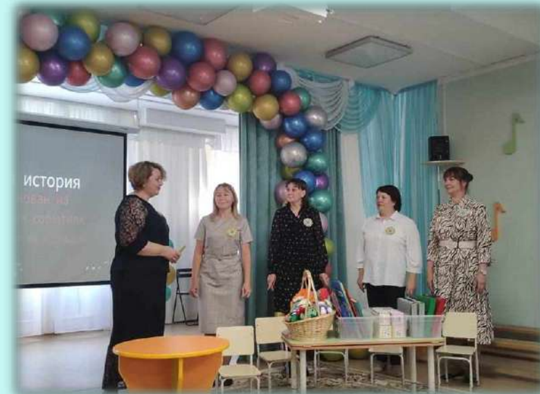
«Воспитатель года 2022»