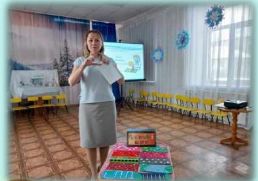
Сенсорные дорожки «Пальчиковые шаги»