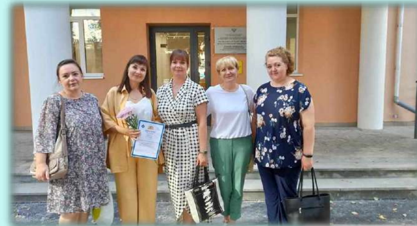
«Учитель – дефектолог России -2022»