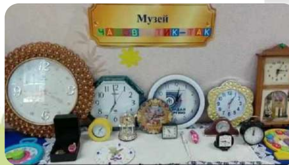
Музей часов «Тик-Так»