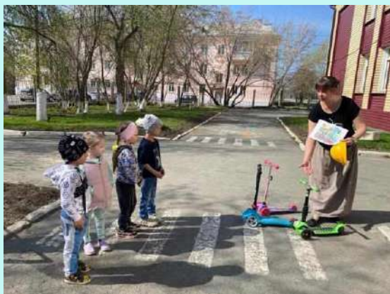
«Знай и умеи»