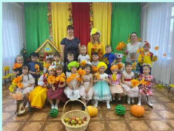
«Осень в гости к нам пришла»