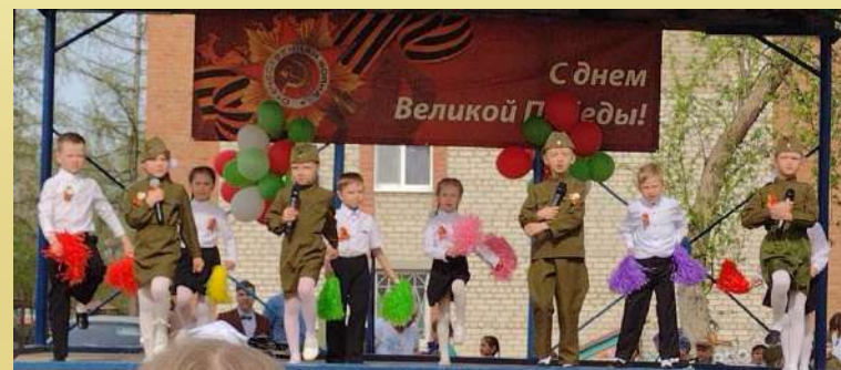
День Metallургов 2022