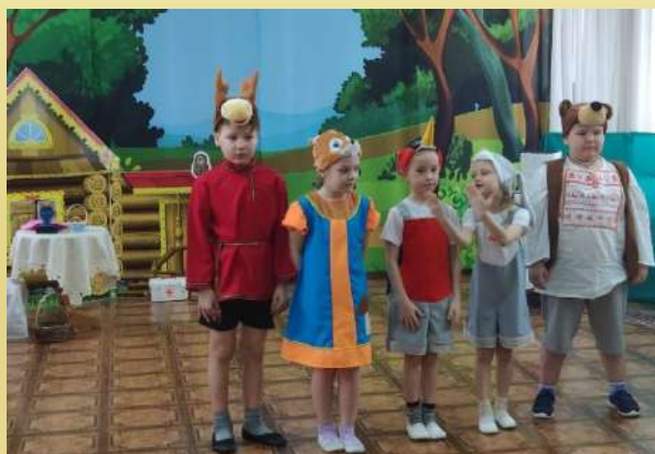
Городской фестиваль «Музыкальная карусель»